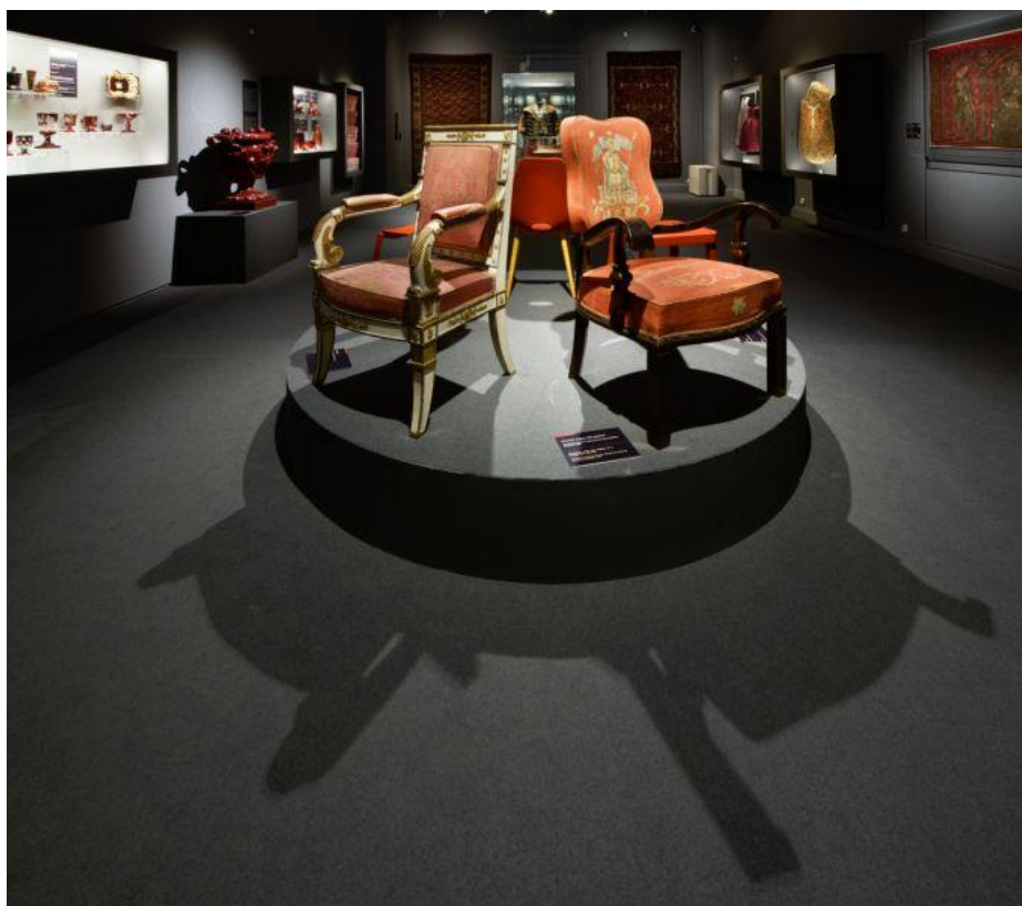
A kiállítás „piros” terme

A kiállítást a MOME TechLab munkatársai által fejlesztett SzínTükör című projekt kíséri. Az interaktív installáció játékos formában állítja szembe a közönség színvilágát a kiállított tárgyak színpompájával. A digitális SzínTükör arról ad képet, hogy a látogatók mennyire színesen öltözködnek. A projekt a látogató öltözkékének színelemzésén alapul: a tükör beszkeneli az előtte álló látogató öltözkékét, s annak jellemző színeiből palettát állít elő, majd a kiállított műtárgyak közül társítja a látogatóhoz azokat, amelyek színben leginkább közel állnak ruhája árnyalataihoz. A kapott eredményből összesítő kép készül, amelyet a