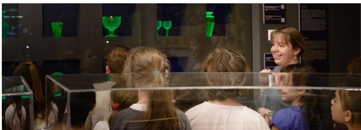
Múzeumpedagógiai foglalkozás a kiállításban