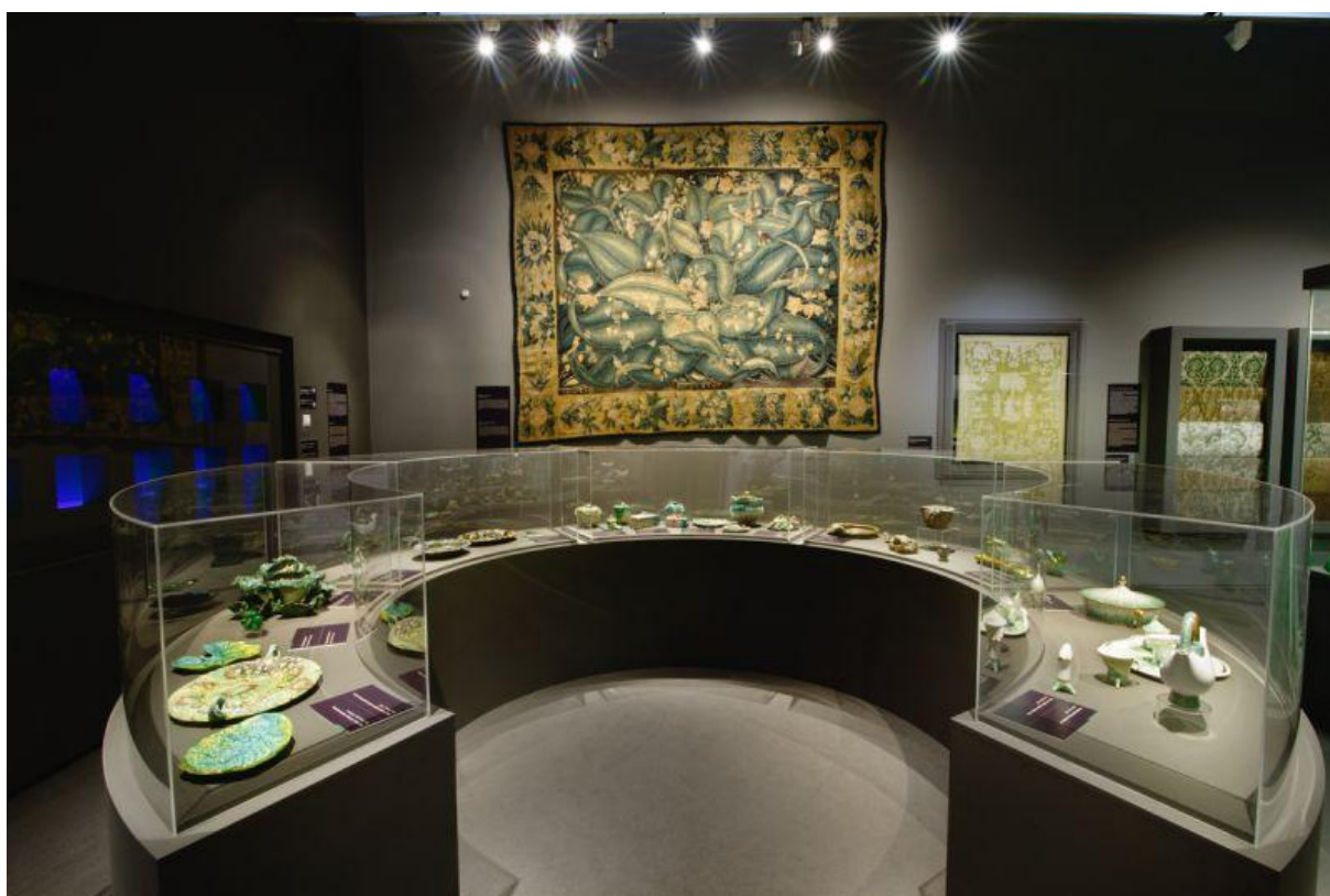
A kiállítás „zöld” terme

Budapest, 2016.06.21. Összeállította: Semsey Balázs – Serfőző Szabolcs