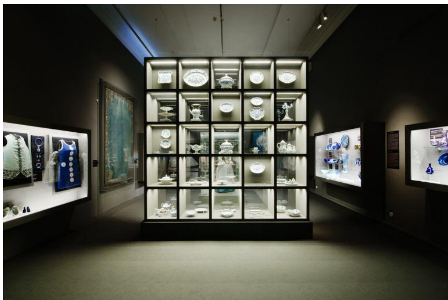
A kiállítás „kék” terme