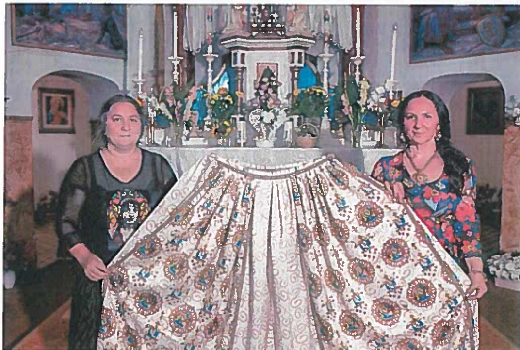
Ráth György Múzeum