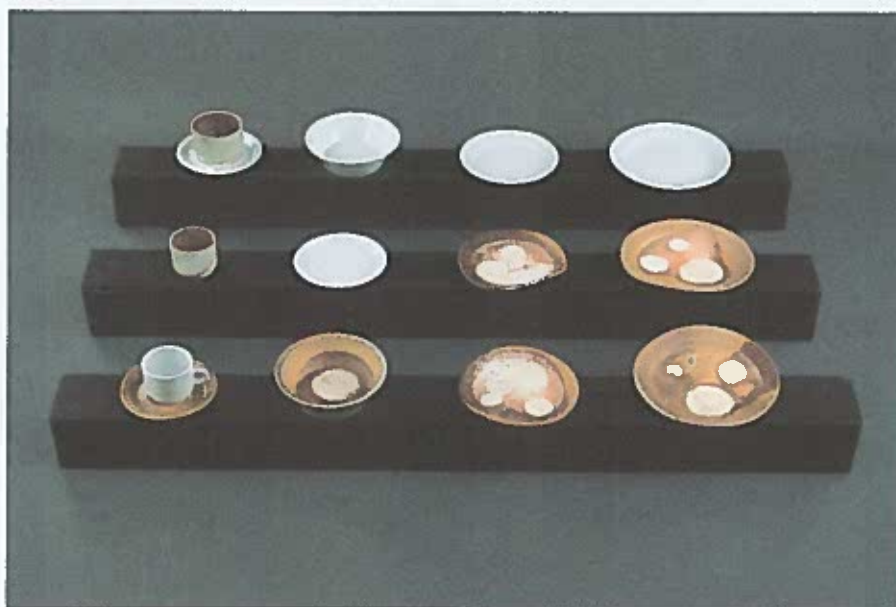
Ráth György-vllla Nagytétényl Kastély